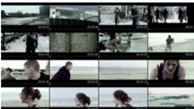
2. Fotogramas del videoclip Isolated system .